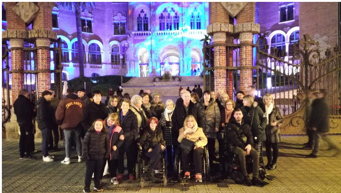
Visita als "Llums de Sant Pau"