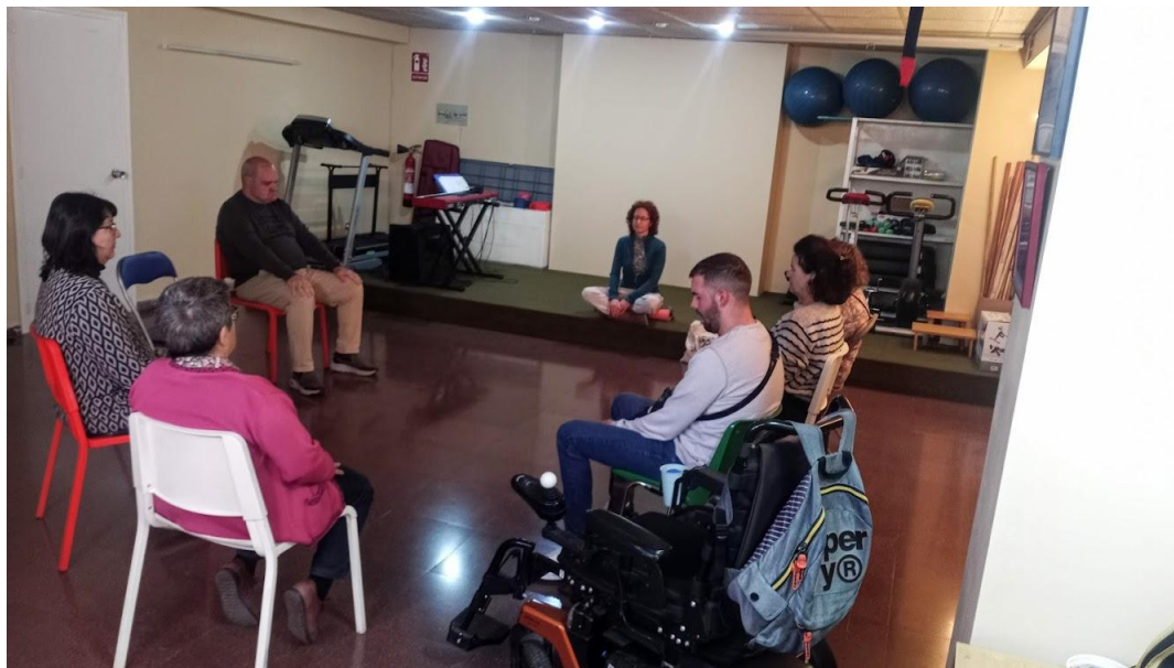
Aprenem a respirar