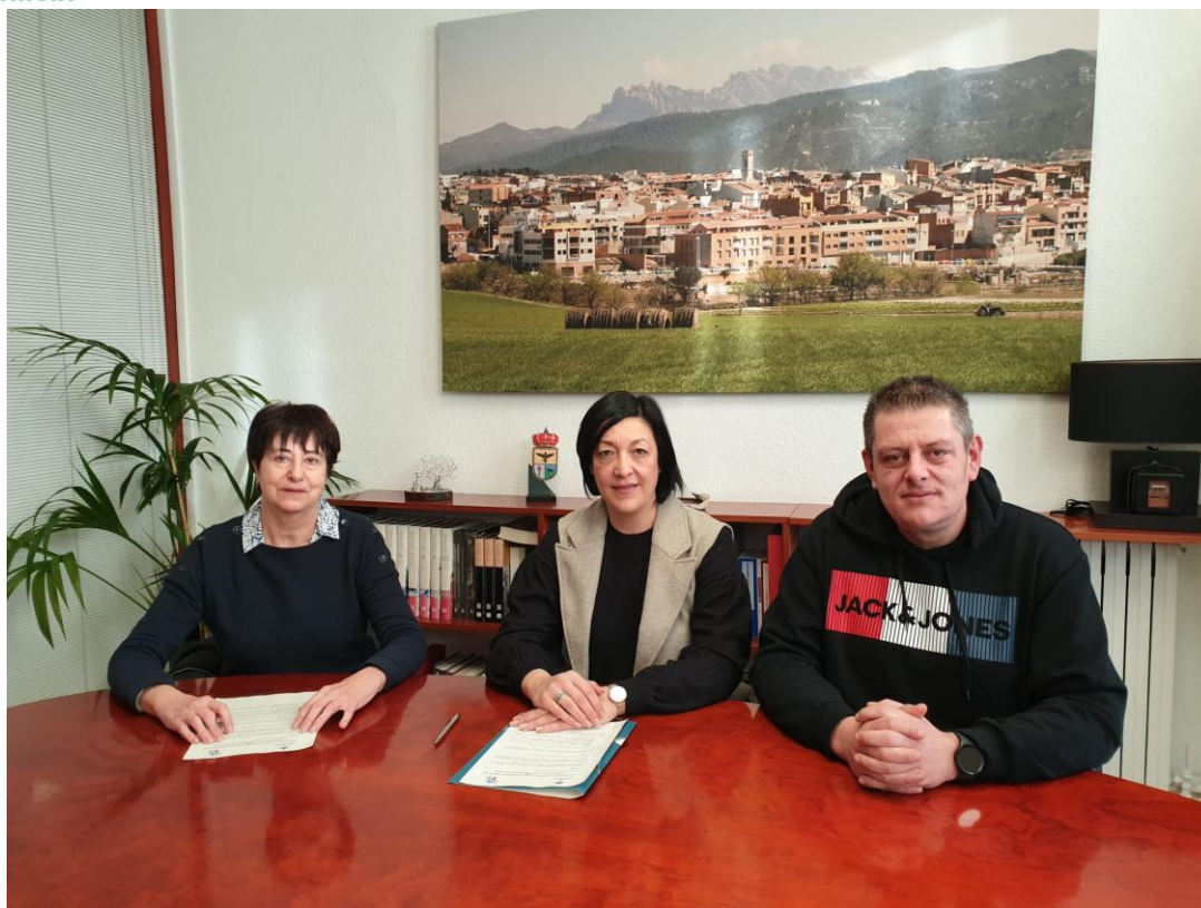
Signatura del conveni amb Vilanova del Camí