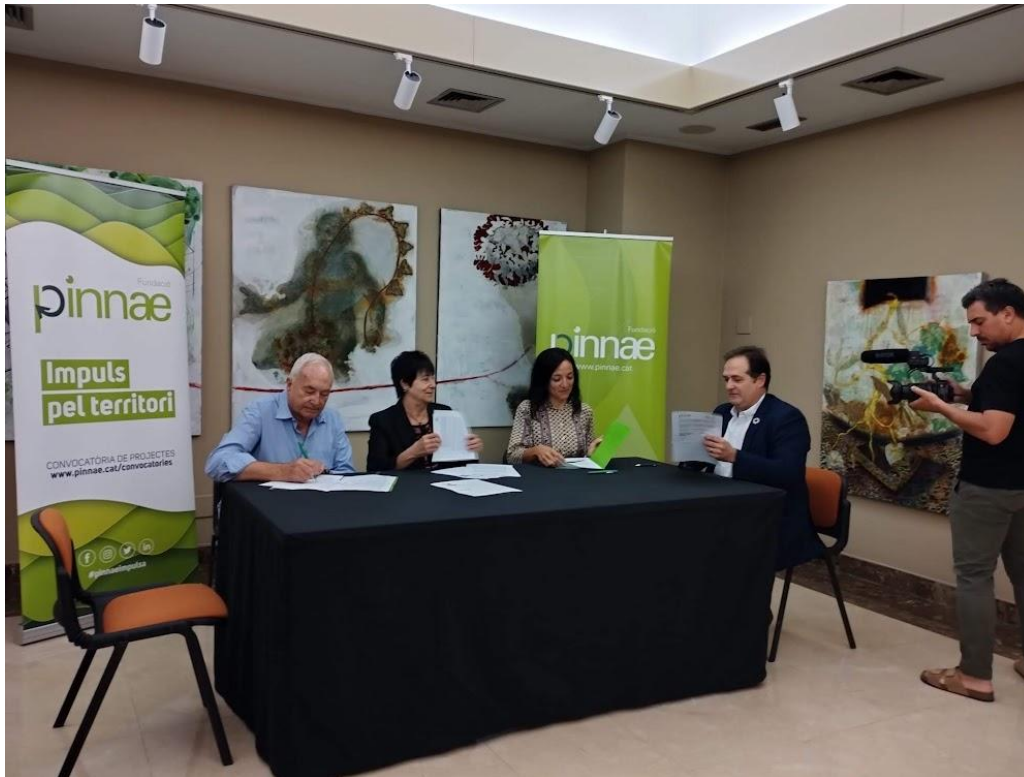
Guardó Fundació Pinnae