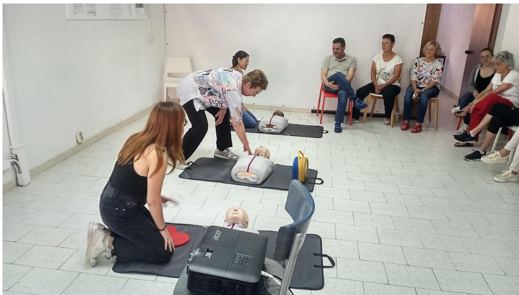
Formació en RCP i DEA