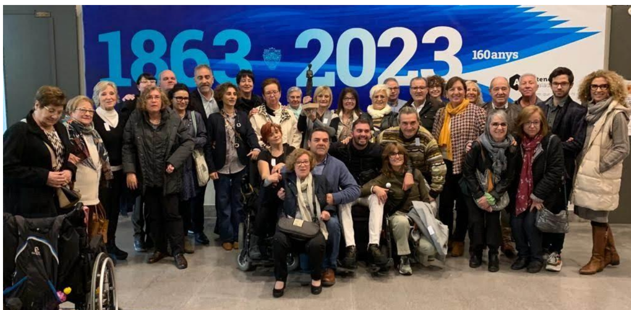
Premi Ciutat d'Igualada 2023 – Premi al compromís social i cívic Mn. Josep Còdol