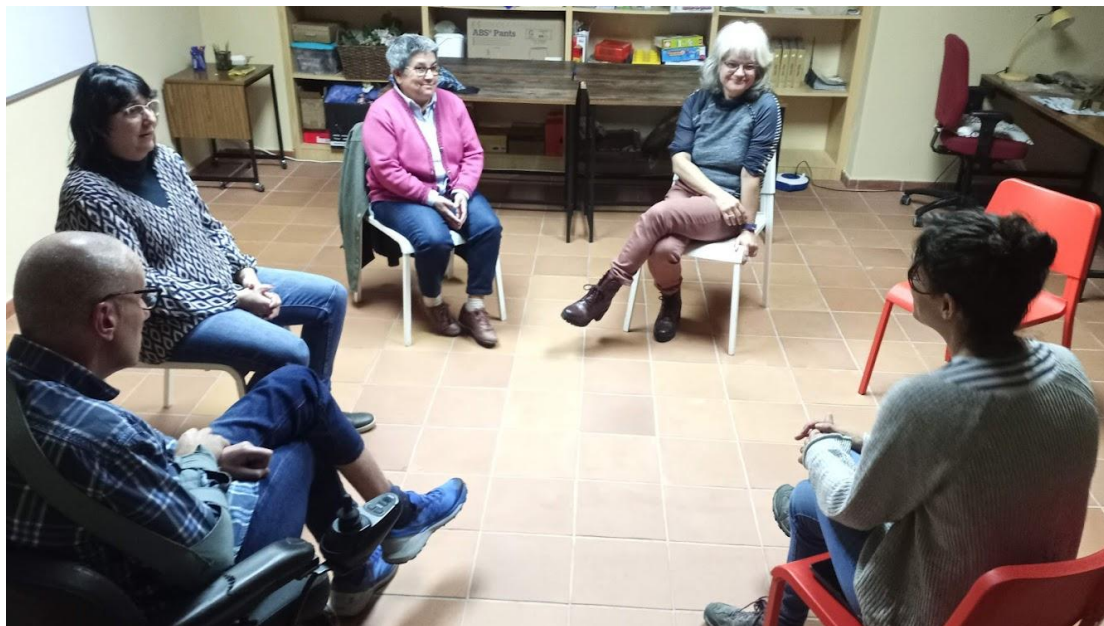
Taller de benestar emocional.