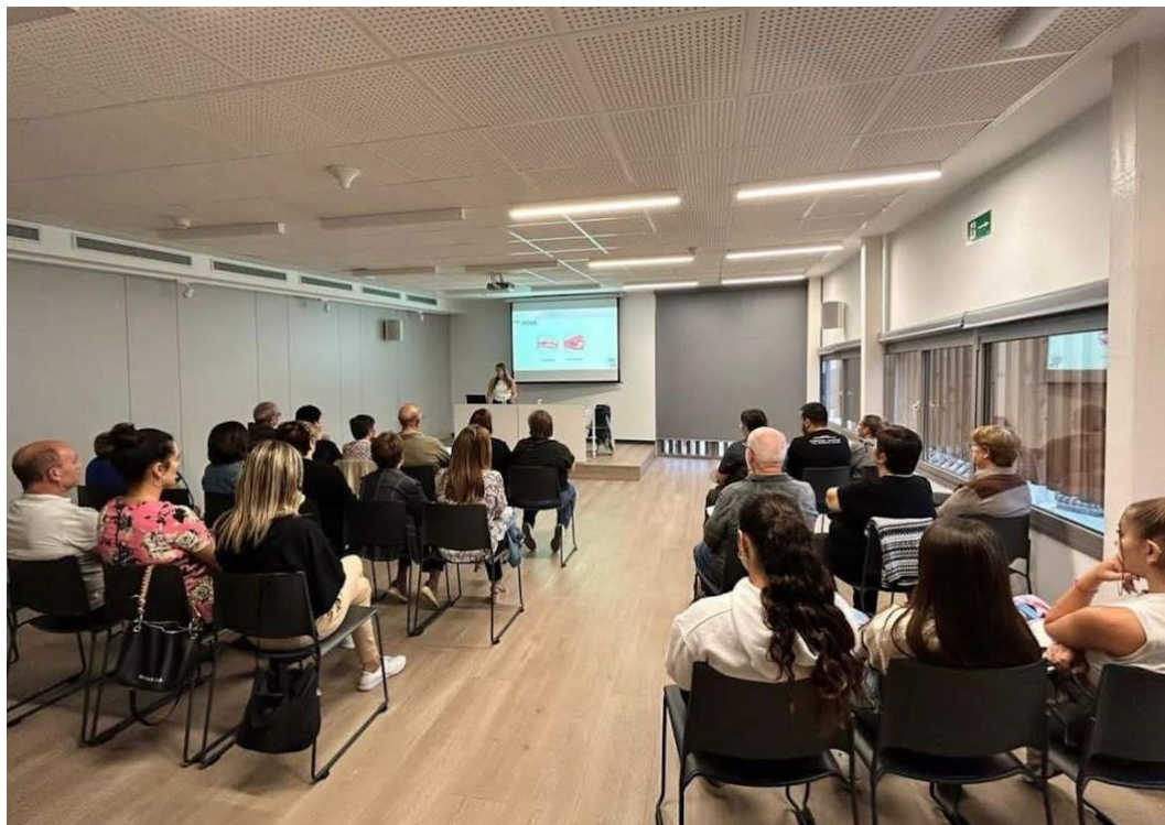
Conferència a la biblioteca d'Òdena