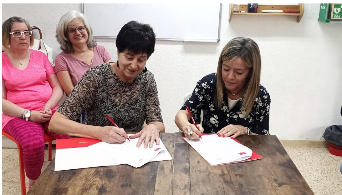
Signatura del conveni amb Synergie