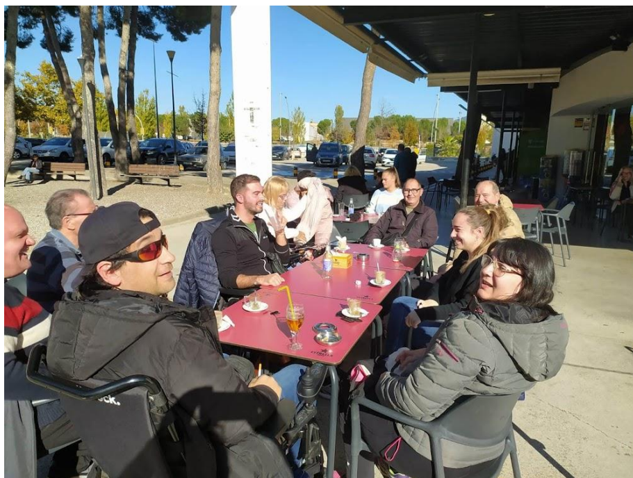
El vermut dels dilluns