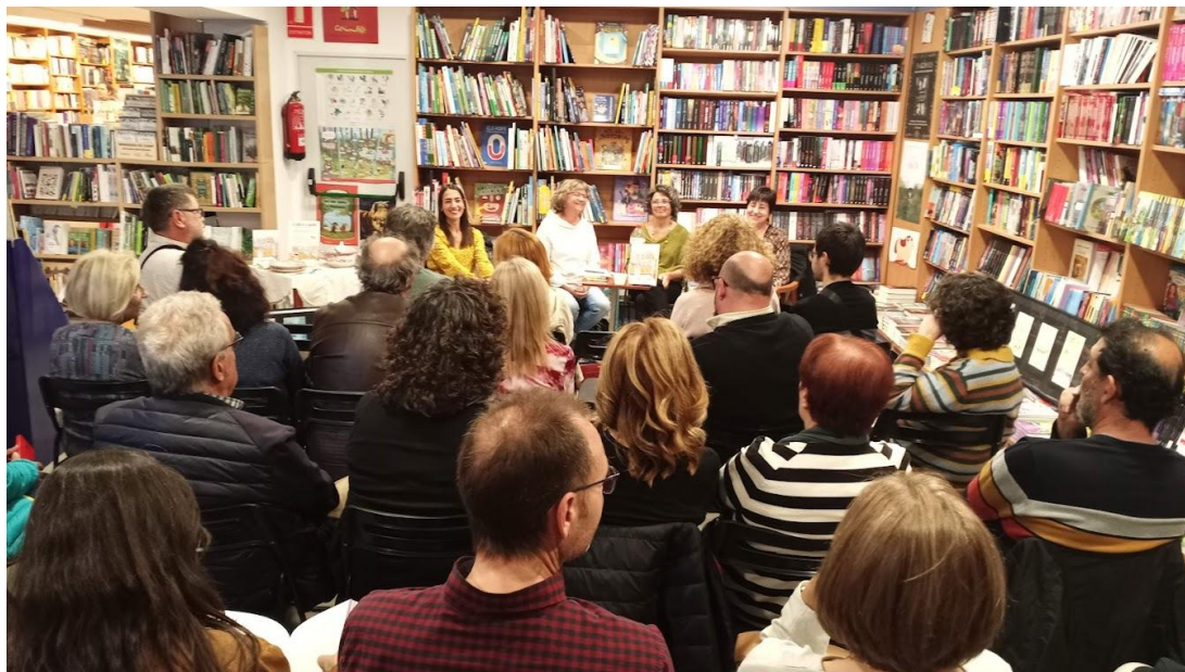
Presentació del llibre "La cuina de la Marina"