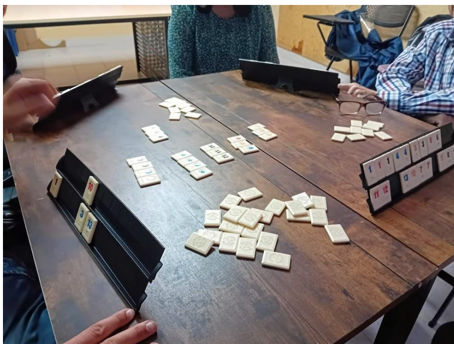
Jocs de taula per moure neurones