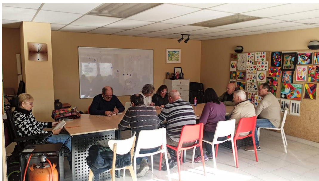
Club de lectura