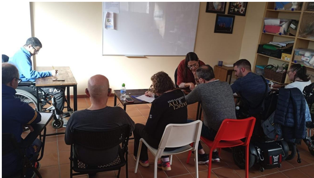
Taller de llenguatge