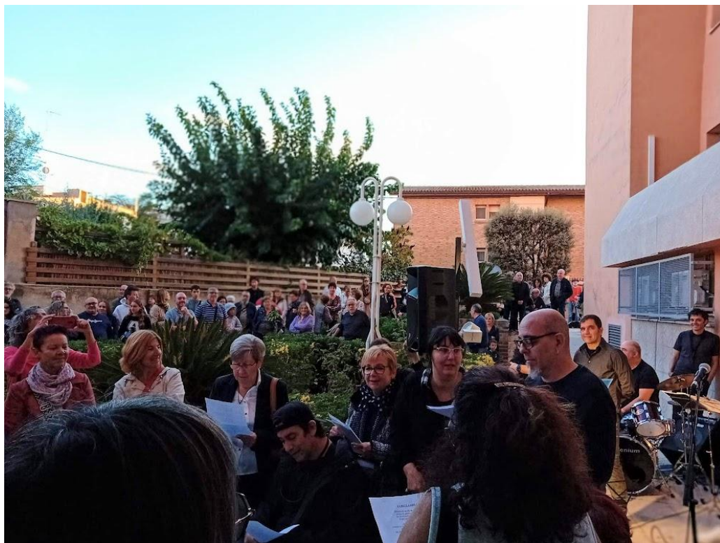
Inauguració local Carrer Capellades