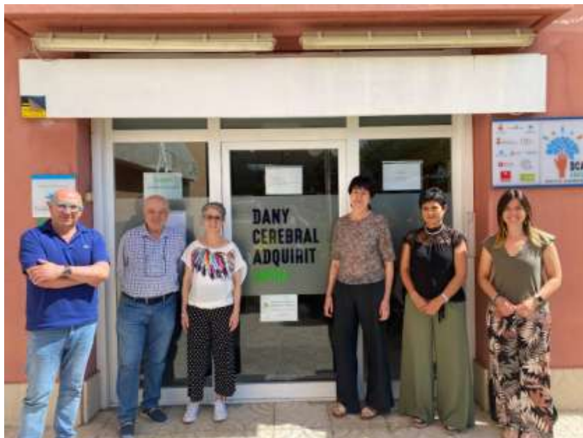
VISITA DE LA VICEPRESIDENTA DEL CONSELL COMARCAL I DE LA CAP DEL DEPARTAMENT DE BENESTAR SOCIAL I ATENCIÓ A LA CIUTADANIA