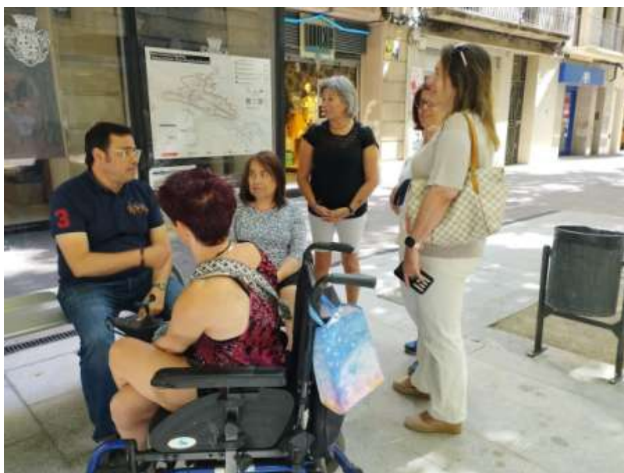
PRESENTACIÓ PARADA AUTOBÚS ADAPTADA A LA RAMBLA D'IGUALADA