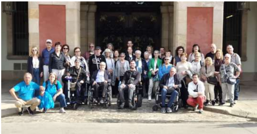
VISITA AL PARLAMENT DE CATALUNYA