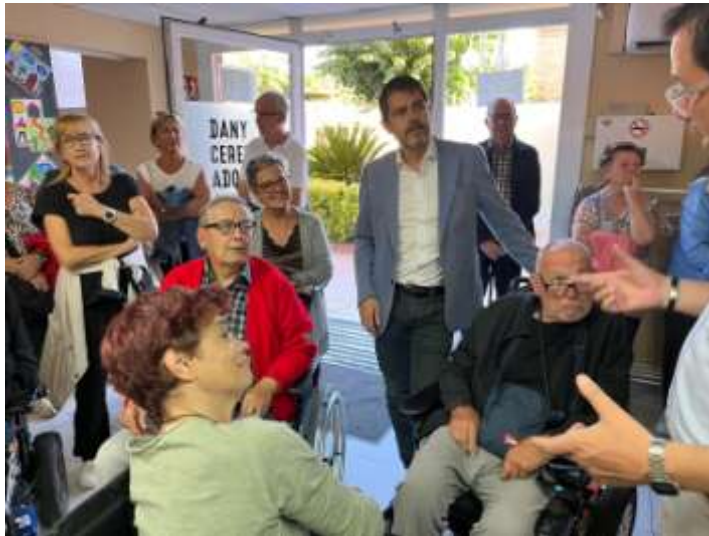
VISITA DE L'ALCALDE D'IGUALADA AL NOSTRE LOCAL