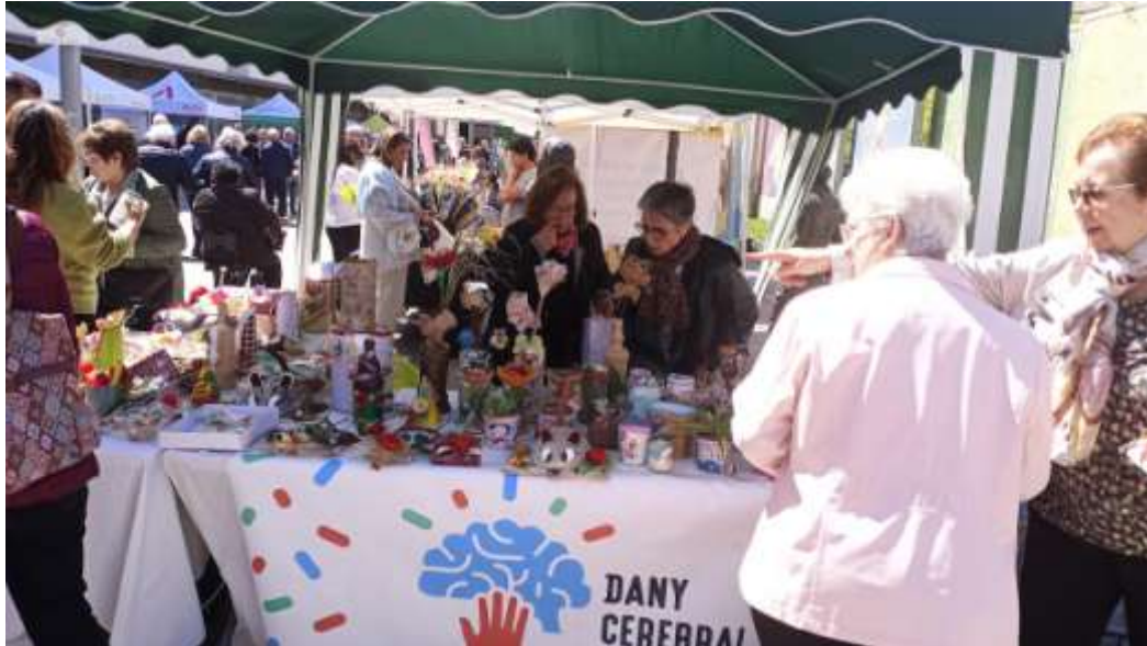
SANT JORDI A LA PLAÇA DE CAL FONT D'IGUALADA