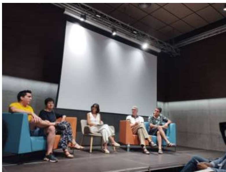
PRIMERA JORNADA D'ESTIU D'ENTITATS D'IGUALADA