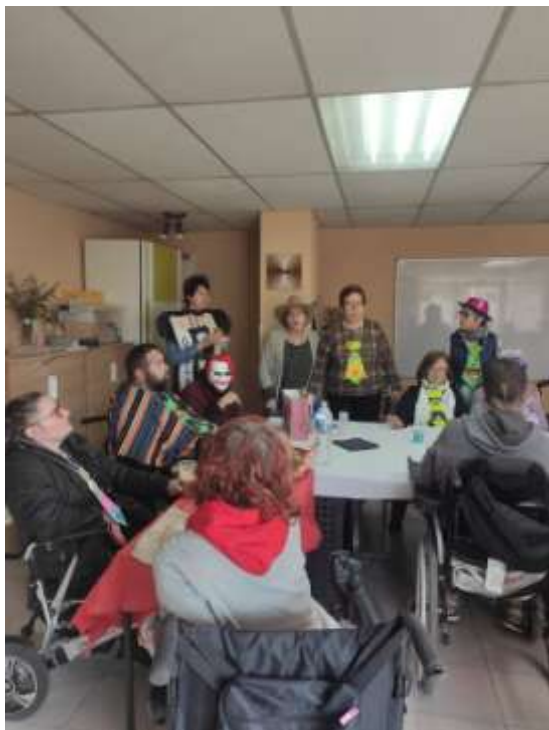
DIJOURS GRAS I CARNESTOLTES