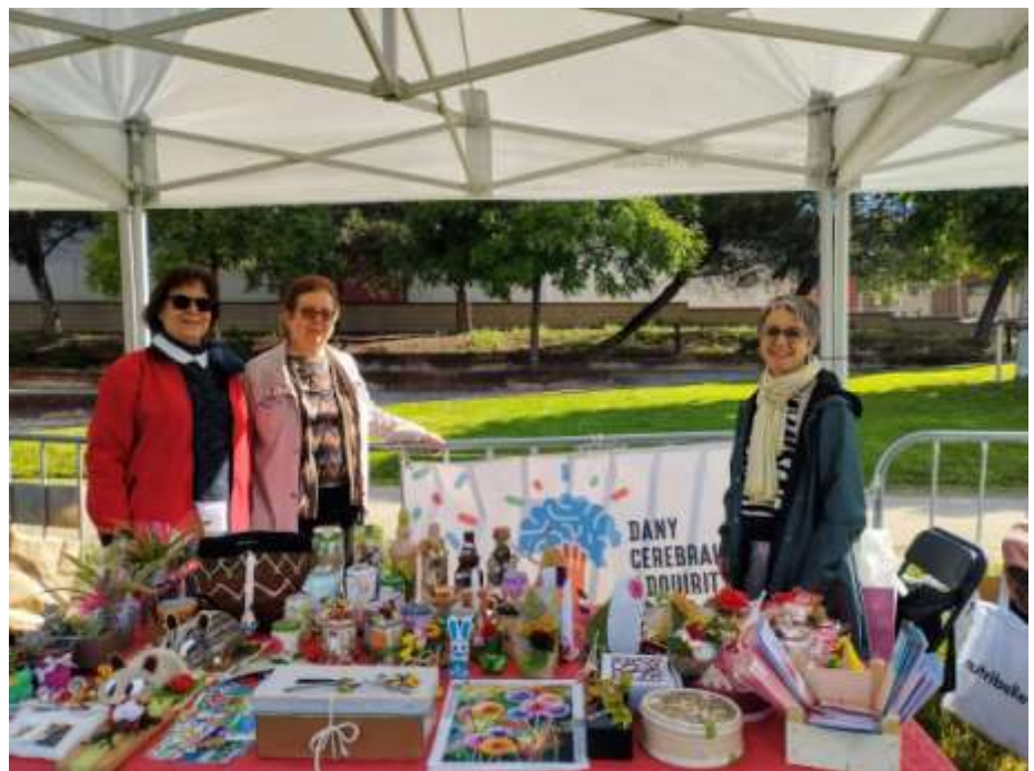
CAP DE SETMANA SALUDABLE AL PARC CENTRAL D'IGUALADA