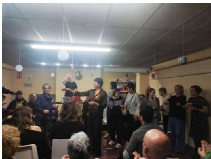
BERENAR DE NADAL